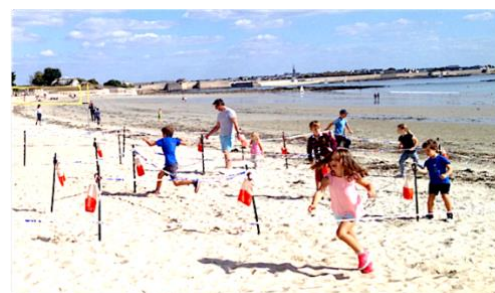
Du plaisir pour tous les publics