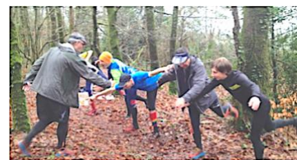
Le travail des capacités physiques

Avec un objectif de gain de temps dans vos préparations et de succès.